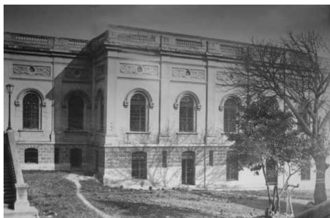
Ilustração 2 - Foto Arquivo Público. Fonte: site da Prefeitura de Porto Alegre

o Prédio III, onde se dá a entrada no Arquivo. Assim, os dois pavilhões seriam lotados, exclusivamente, por documento, enquanto a administração alojar-se-ia, em frente aos prédios, na referida casa.