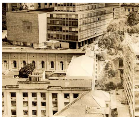
Ilustração 3 - Foto Arquivo Público. Fonte: site da Prefeitura de Porto Alegre

Em 1948, o então governador Walter Jobim, relatou na Assembléia Legislativa que providência de maior vulto fora a liberação de verbas para a construção de um novo prédio para o Arquivo. Esta edificação seria destinada para abrigar as atividades administrativas e técnicas da casa, tais obras iniciaram no ano de 1948 e foram concluídas em 1950.