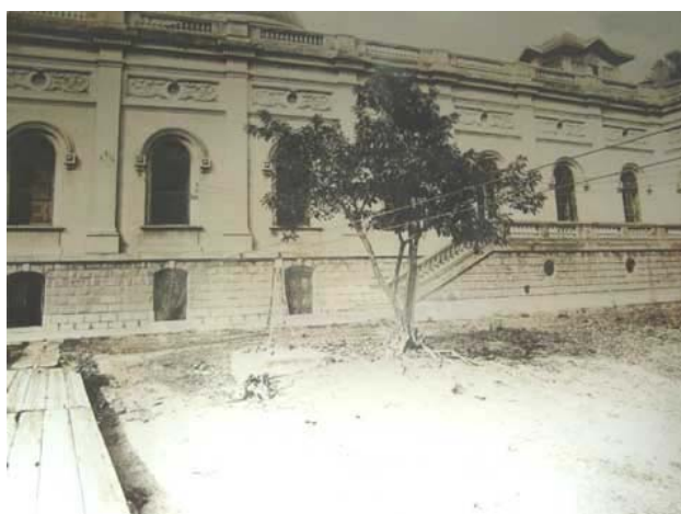
Ilustração 1 - Foto Arquivo Público. Fonte: site da Prefeitura de Porto Alegre

No ano de 1912, no local onde situava-se o prédio da “Bailante” foi construído o antigo Teatro Araújo Viana, onde atualmente encontra-se o prédio da Assembléia Legislativa. Este fato não apresentou problema ao Arquivo, pois entre 1908 e 1910, tiveram início as obras que hoje configuram o Prédio I. O projeto foi atribuído ao arquiteto francês Maurício Gras e coube ao diretor da Repartição de Obras, Afonso Hebert, a execução. Após dois anos, em 18 de novembro de 1912, o prédio foi concluído, estando pronto para receber os documentos.